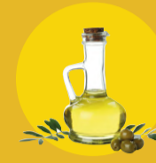
ACEITE DE OLIVA