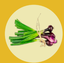
CEBOLLA DE VERDEO