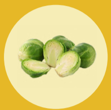
REPOLLITO DE BRUSELAS