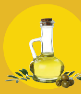
ACEITE DE OLIVA