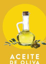
ACEITE DE OLIVA