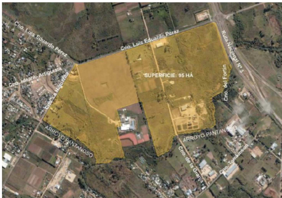
1. Predio de la UAM

A su vez, se encuentra contiguo a las áreas de producción hortofrutícola y las áreas de consumo. El 60 % de la demanda total de alimentos frescos y el 60 % de la población total del país residen en el área metropolitana de Montevideo.